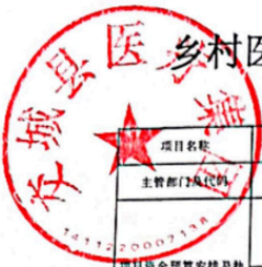
乡村医生个人要素县级补助项目支出绩效自评表 (2024年度)