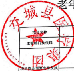
老年退养乡医补助项目支出绩效自评表 (2024年度)